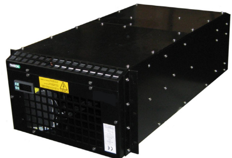
Esempio di montaggio su armadio standard Rack Mounting example inside a standard rack cabinet